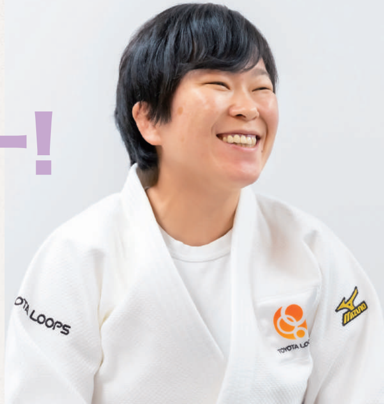
<半谷静香さんプロフィール>1988年福島県生まれ。トヨタループス株式会社所属。女子柔道選手。視覚障がい(全盲クラス)を持ちながら競技を続け、国内外の大会に出場。2012年ロンドンパラリンピックから4大会連続出場し、2024年パリパラリンピックで悲願のメダルを獲得した。(48Kg級/J1クラス/銀メダル)